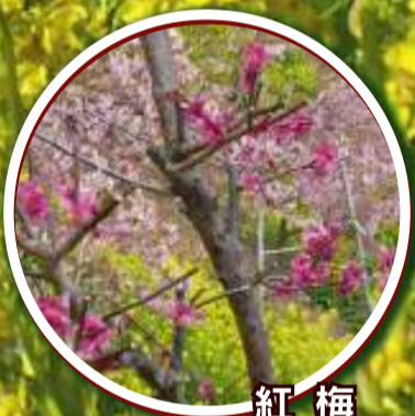
紅梅 2月上旬-2月下旬